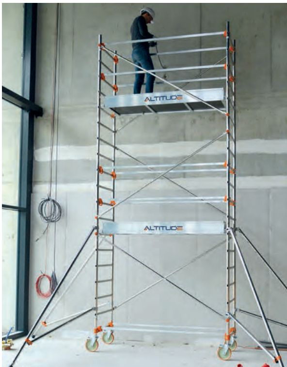
AL205 version standard Hauteur travail 5.90 m