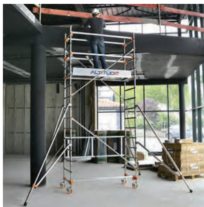
AL165 version base pliante Hauteur travail 4.80 m